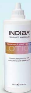
Uso profesional ENVASE 500 ml

Con suave aroma de bambú y de textura muy agradable, incluye extractos vegetales como el fucus, la cola de caballo o el castaño de indias entre otros, que refuerzan la eficacia anticelulítica del tratamiento. Su efecto anticelulítico se potencia gracias a su acción de hidratación máxima.